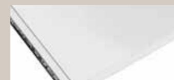
Glatki / Smooth

Statička svojstva (kg/m 2 ) Static properties (kg/sq.m.)