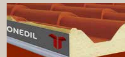
Spajanje brtvom i okapnicom Joint with gasket and drip element