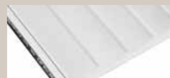
Prugasti / Scored