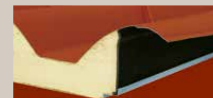
Crijep sa preklapom Overlapping tile

Ostali metali i različite debljine su dostupne na zahtjev Other metal supports and different thicknesses are available upon request.