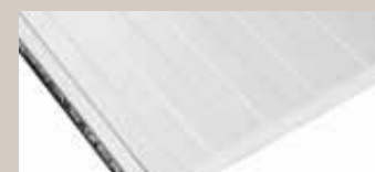
Rešetasti / Staved

Mikroliniranje sa DONJE strane (navodi se prilikom naručivanja) Micro-veining of the LOWER side of the panel (to be specified when ordering)